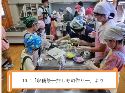
10.4「収穫祭—押し寿司作り—」より