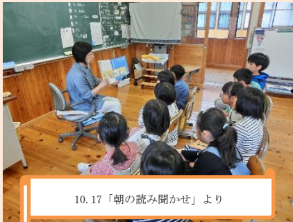
10.17「朝の読み聞かせ」より