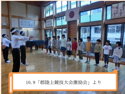
10.9「郡陸上競技大会激励会」より