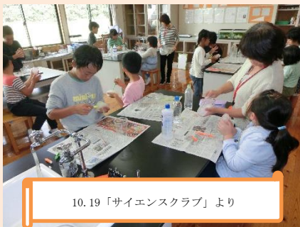
10.19「サイエンスクラブ」より